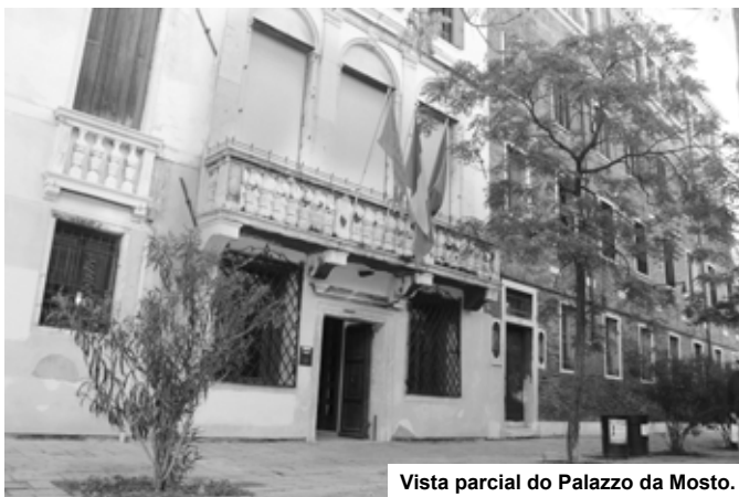
Vista parcial do Palazzo da Mosto.

Palazzo da Mosto - Edifício que a partir de 1806 passou a escola que ainda hoje se encontra ativa.