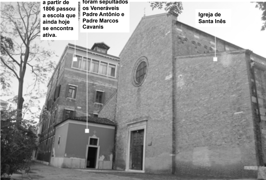
Igreja de Santa Inês