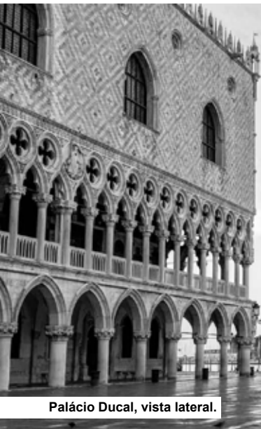
Palácio Ducal, vista lateral.

O Palácio Ducal (Palazzo Ducale) está situado na Piazza San Marco. Deste lugar, 120 doges dirigiram o destino de Veneza durante quase 1.000 anos.